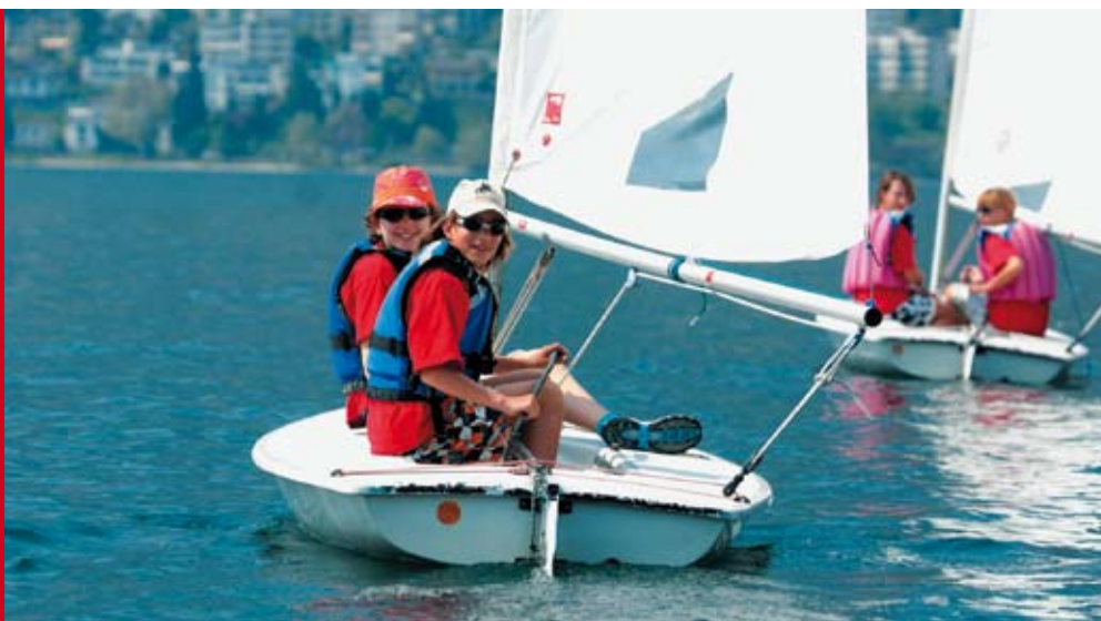
Thuner Kadetten haben das Ruder fest in der Hand.

Nach einer unterschiedlich ruhigen Nacht wurden wir um 7.15 Uhr geweckt. Etwas aufgeregt und voller Freude erwartete man den Ausflug nach Luino. Schnell packte jedes einen Lunch ein und schon marschierte das Korps Richtung Bahnhof Tenero. Die letzten Meter wurden gerannt, sonst wäre der Zug ohne die hellblaue Schar losgefahren. Das Schiff erwartete uns Thuner bereits an der Ländte. Nach einer zweistündigen, anstrengenden Fahrt über den