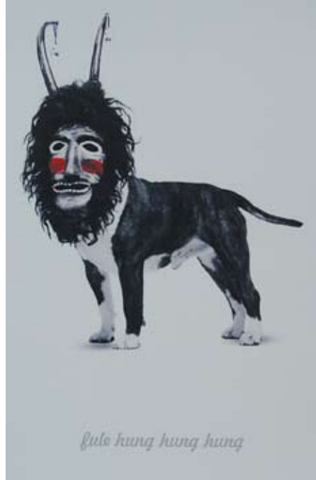
Hanspeter Gempeler, «fule hung hung hung», 2007 Pigmentierter Inkjetdruck, handkoloriert, Papierrösse 55 x 38 cm, Auflage 100.

Für das Kunstblatt 2007 liess er sich was Besonderes einfallen. In einer Art Fotocollage verband er die bekannte Narrenmaske mit einem Hundekörper – der Name «Fulehung» erfährt so eine neue visuelle Präsenz. Mittels hoch auflösendem Pigmentinkjet wurde das Motiv zuerst auf Büttenspapier gedruckt; danach hat der Künstler jedes Exemplar mit Aquarell handkoloriert. Die Ambivalenz zwischen Anziehung und Abstossung unseres «Bajass» kommt im Blatt sehr gut zum Ausdruck. In fast humoristisch-karikierter Weise schafft er ein neues Fabelwesen, das sein Unwesen wohl schon in manchem Thuner «Kinderkopf» getrieben hat. Die Aufregung und Erwartung steigert sich übers Jahr – und plötzlich ist er da: fule, hung, hung, hung! Ein spezielles Blatt, das die Sammlung unserer «Kunst-Fulehüng» sicherlich bereichern wird.