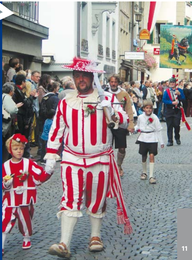
Tell mit Tellenbuebli (oben) und Schwizermaa mit Buebli (rechts) am traditionellen Umzug durch die Gassen von Thun.