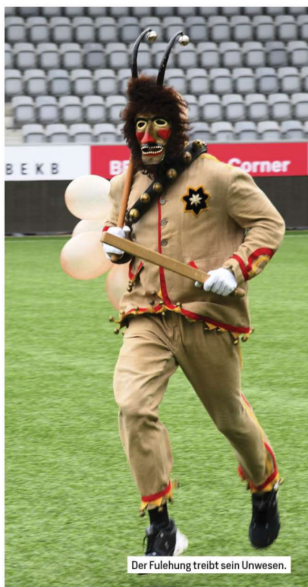
Der Fulehung treibt sein Unwesen.

Nr. 193679, online seit: 27. September – 14.02 Uhr