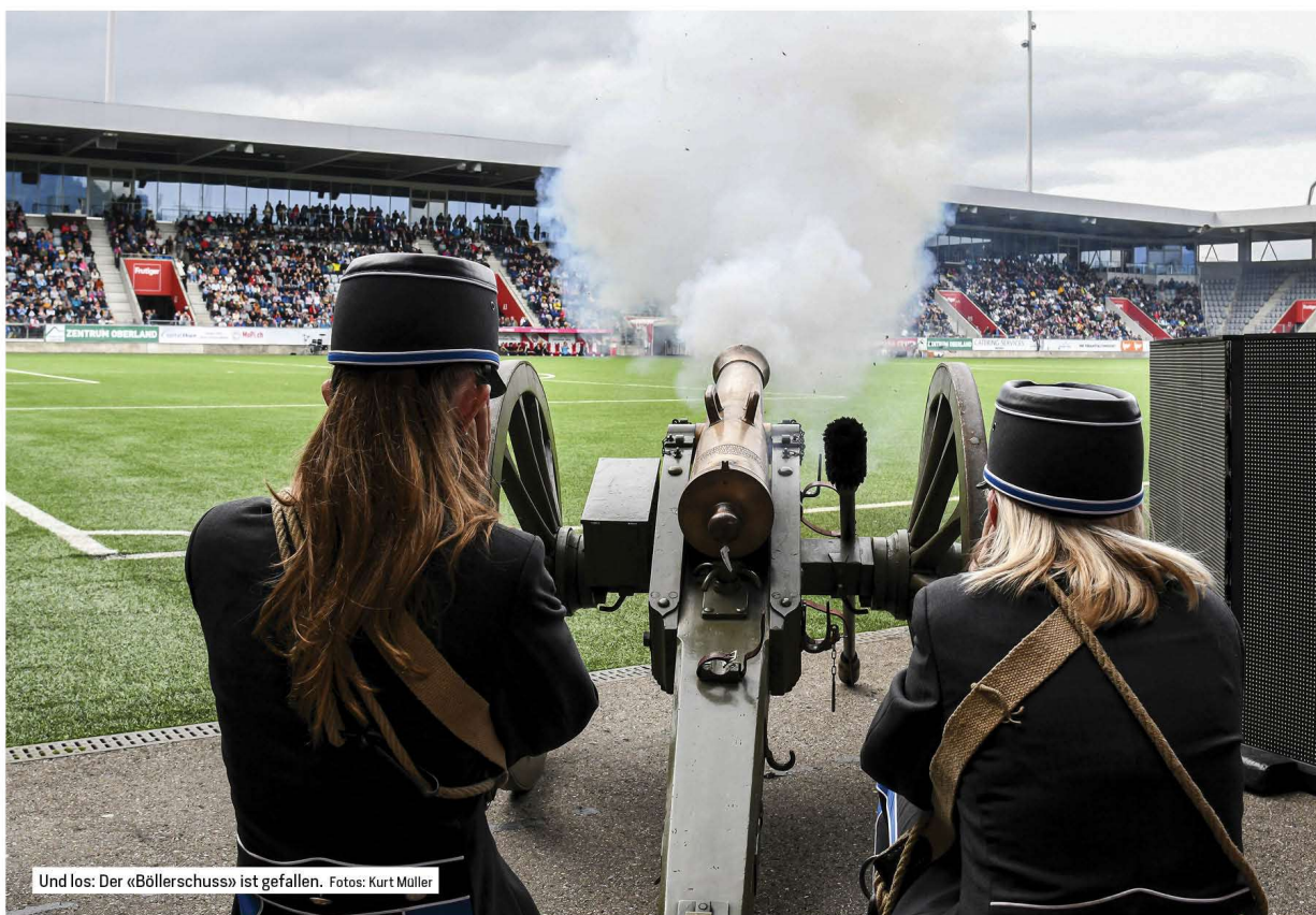
Und los: Der «Böllerschuss» ist gefallen.

Am Sonntag fand in der Stockhorn Arena die Eröffnung des traditionellen Ausschieses statt. Den Thuner Kadettinnen und Kadetten gab der FC Thun Berner Oberland sein Heimrecht gerne ab. Gut 2000 Besucherinnen und Besucher erlebten ein einmaliges Volksfest – hautnah auf den Sitzplätzen.