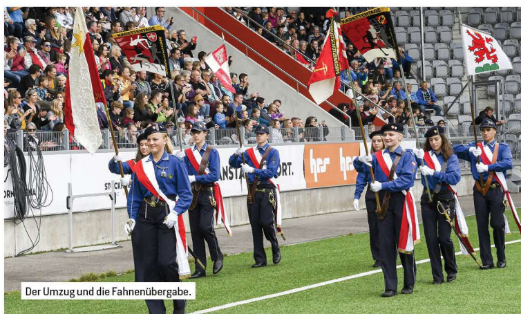
Der Umzug und die Fahnenübergabe.