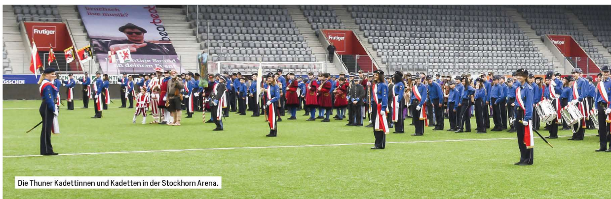
Die Thuner Kadettinnen und Kadetten in der Stockhorn Arena.