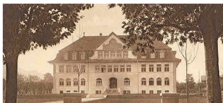
Das fertig gebaute Lehrerinnenseminar.